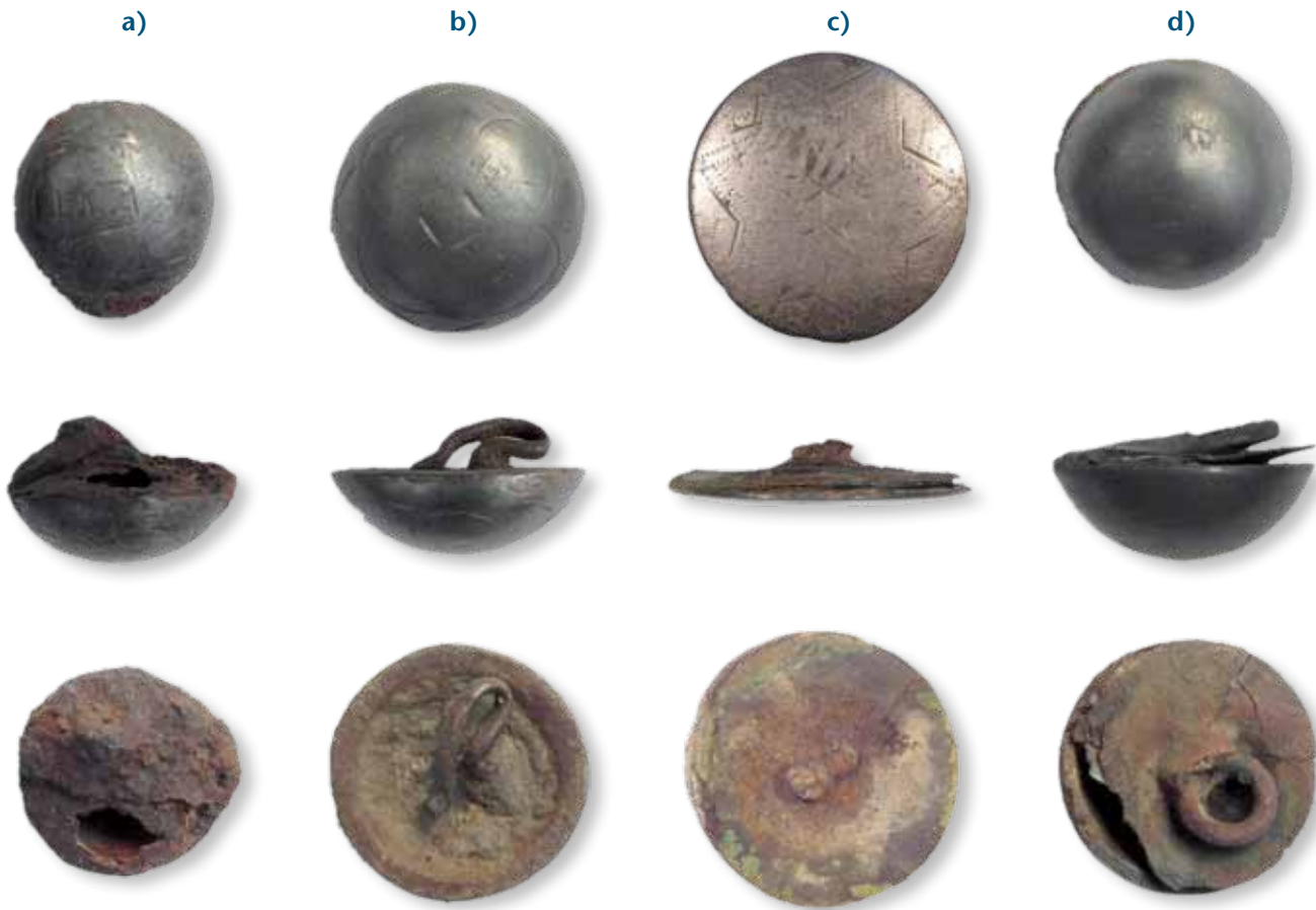
Verschiedene Befestigungsarten der Öse an der Knopfschale: a) Platte und wohl auch Öse aus Eisenblech; b) Öse aus Kupferdraht, vermutlich mit Blei/Zinn-Legierung angelötet; c) Platte aus Kupfer/Öse aus Eisendraht (Umland von Lauenburg/Elbe); d) Platte und Öse aus Kupfer (Schmilau). Durchmesser von c) ca. 2,3 cm